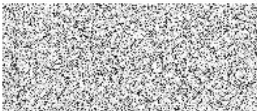
Bc. Silvie Dolanská