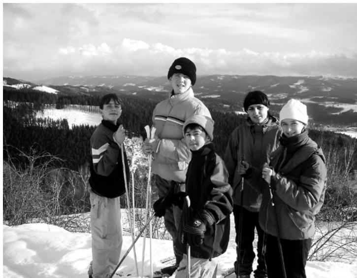
Děti z internátu ZvŠI Vizovice

Během jarních prázdnin jsme se zúčastnili s našimi tetami 6-denního ozdravného pobytu v Dolní Bečvě. Ubytování bylo podle našich představ, nezklamala nás ani pravá česká kuchyně, která nám dodávala nutný přísun energie a tuku. Nic jsme nelenili a celí jsme se oddali „kamarádkám“ běžkám. Disciplinovaně jsme se zařadili za sebou a razili jsme cestou necestou po krásné beskydské přírodě. Několikrát se nám naskytl nádherný výhled do okolí. Síla a disciplína nás neopouštěly ani, když nás potkala menší sněhová bouře, jenom humor byl pryč, protože jsme se báli o své holé životy. Naší pozornosti neunikla ani díla našich předků – Valašské muzeum v přírodě v Rožnově pod Radhoštěm, nově zrekonstruované historické stavby Maměnka a Libušín, ledové sochy na Pustevnách. Do našeho programu jsme vtáhli i nové tváře. Byli to rekreanti z různých koutů ČR, kteří nás strašili na naší večerní stezce odvahy. Každý se těžko loučil, někdo s dobrou kuchyní, jiný s novými kamarády, ale hezké vzpomínky a „kamarádky“ běžky jsme si odvezli zpět do Vizovic.