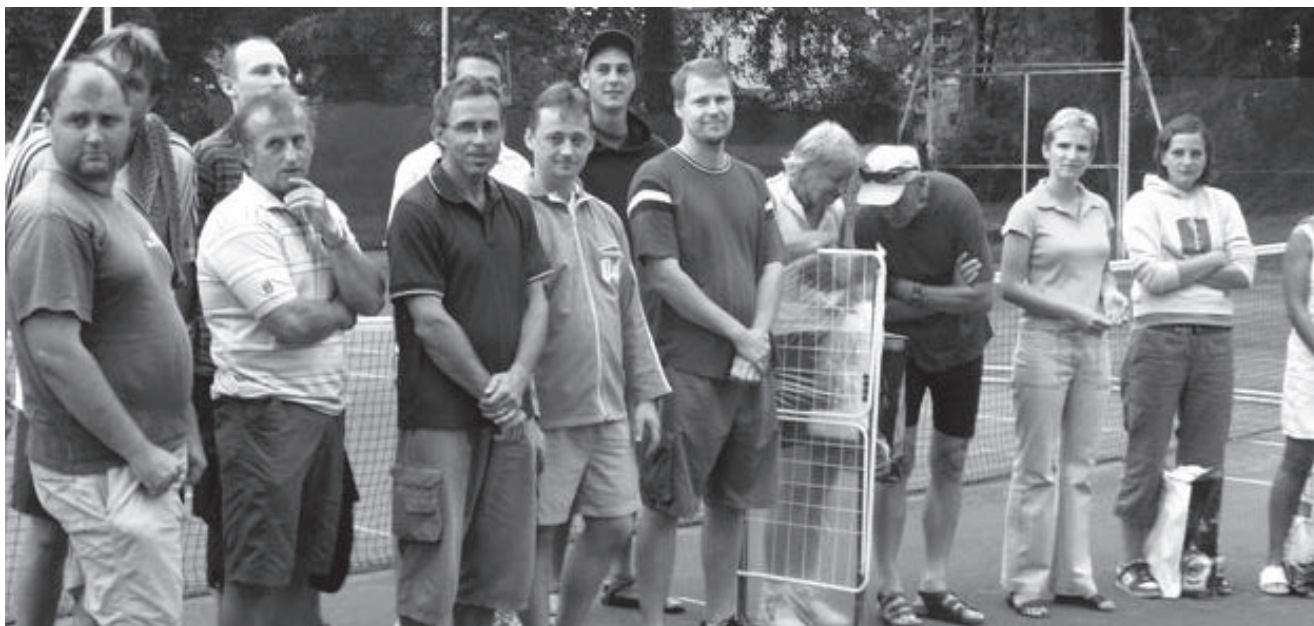
Účastníci 22. ročníku Memorialu Ludka Dintery při závěrečném vyhlásování vítězů.

Ve dnech 20. – 28. července proběhl na vizovických kurtech 22. ročník Memoriálu Ludka Dintery. Ti, kteří tuto akci sledují, ví, že už léta se k hlavní kategorii neregistrovaných mužů připojily kategorie neregistrovaných žen a také registrovaných hráčů a hráček. Nejinak tomu bylo i letos. Příjemné počasí i počet přihlášených zajistily hladký průběh akce, která je nejprestižnějším turnajovým podnikem roku.