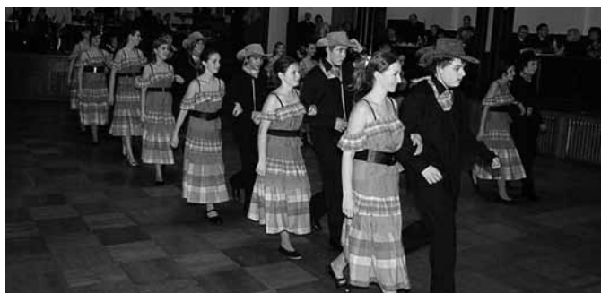
Devafákům to moc slušelo.