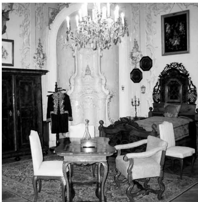
Novinka na prohlídkové trase „A“ - ložnice hraběte.

volných příspěvcích - neuvěřitelných 12 250 Kč! Jako každý