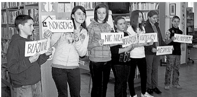
Literární pásmo NONSENS žáků 7. třídy ZŠ.

Březen – měsíc čtenářů. Svaz knihovníků a informačních pracovníků ČR vyhlásil měsíc březen – měsícem čtenářů. Tato akce navazuje na dřívější Březen – měsíc knihy a Březen – měsíc internetu. V centru zájmu knihovníků se stal čtenář a čtení, ne tedy kniha jako předmět ani knihovna jako instituce, ale každý čtenář, který čte knihu, časopis nebo e-zdroje. Do popředí zájmu se tak dostává každý aktivní čtenář, který knihovnu navštěvuje pravidelně nebo jen občas, ale i ten čtenář, který v knihovně nikdy nebyl a (zatím) ani být nechce.