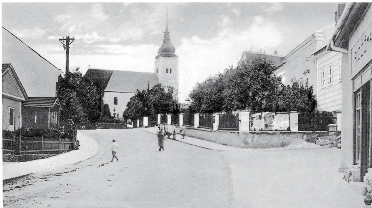
Vizovice. Kostel a část Palackého náměstí.