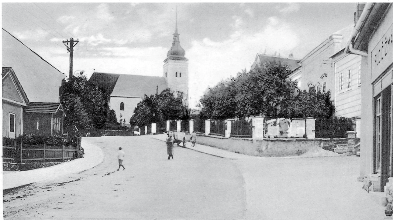
Vizovice. Kostel a část Palackého náměstí.

Vizovice, 1929, vydal B. Kaluža, zapůjčil Jiří Madzia.