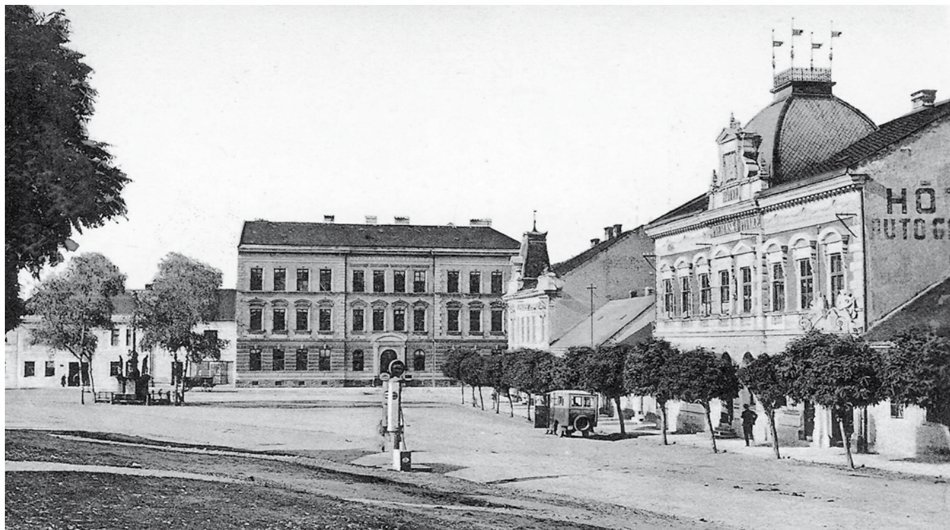
Masarykovo náměstí, Vizovice, 1929, vydal Bedřich Kaluža, zapůjčil Jiří Madzia.