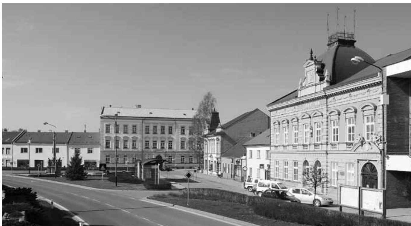
Masarykovo náměstí, Vizovice, březen 2010, foto Radek Mládenka.