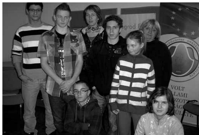
Snímek dětí a vychovatelek ze setkání v Rodowu-Sorkwitech.

ná na poznávání dětí a života v jejich dětských domovech a seznámení se s blízkým okolím Rodowa. Absolvovali jsme turistickou vycházku k Mazurským jezerům a výlet do Olstynu, který je hospodářským, vzdělávacím a kulturním centrem Varmijsko-mazurského vojvodství. Je univerzitním městem s hezkým historickým centrem,