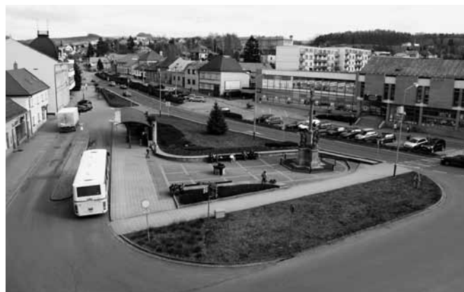
Vizovice – ilustrační foto.