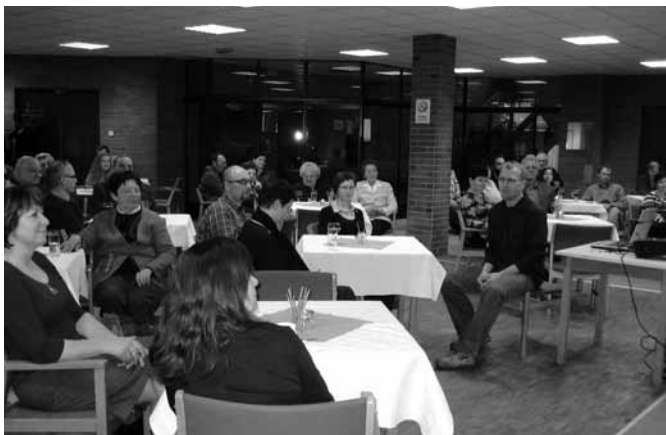
Zajímavé téma přednášky oslovilo mnoho zájemců.