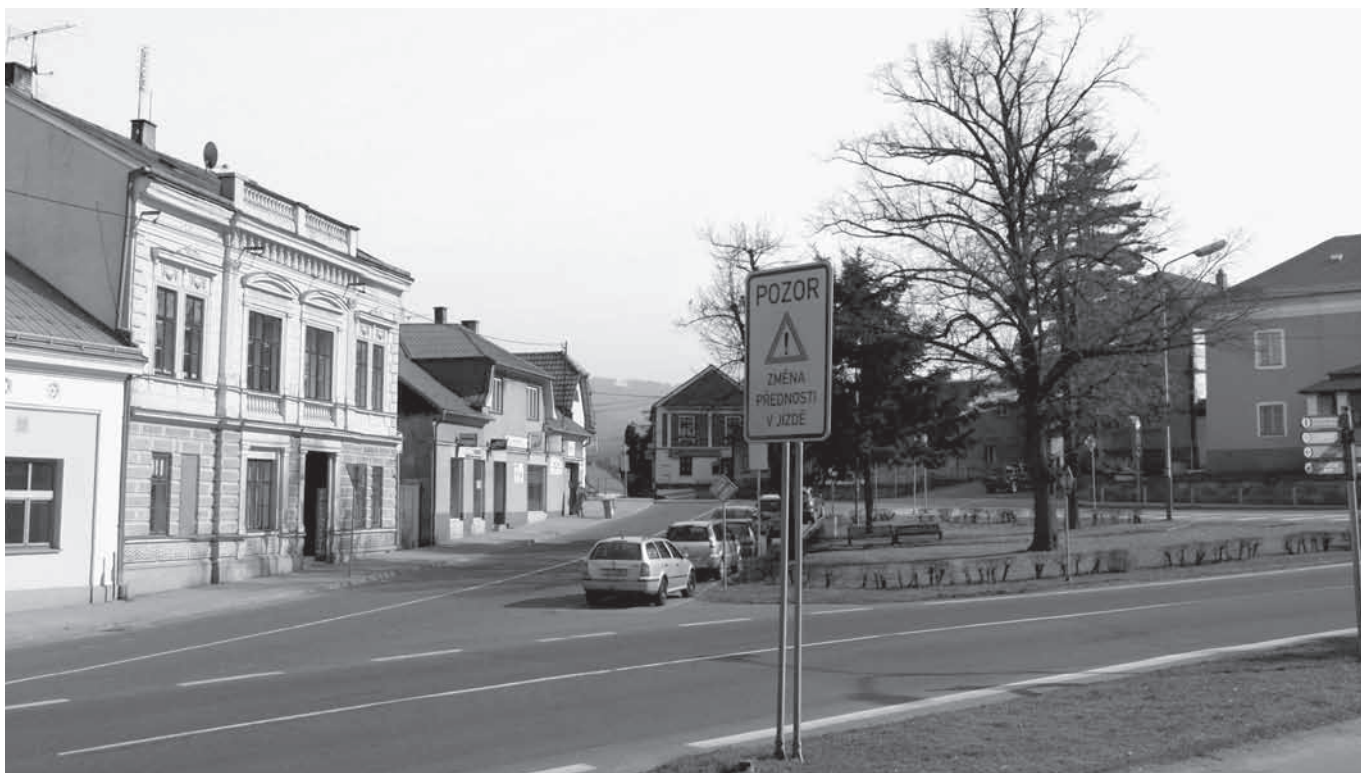
Vizovice, Palackého náměstí, březen 2011.