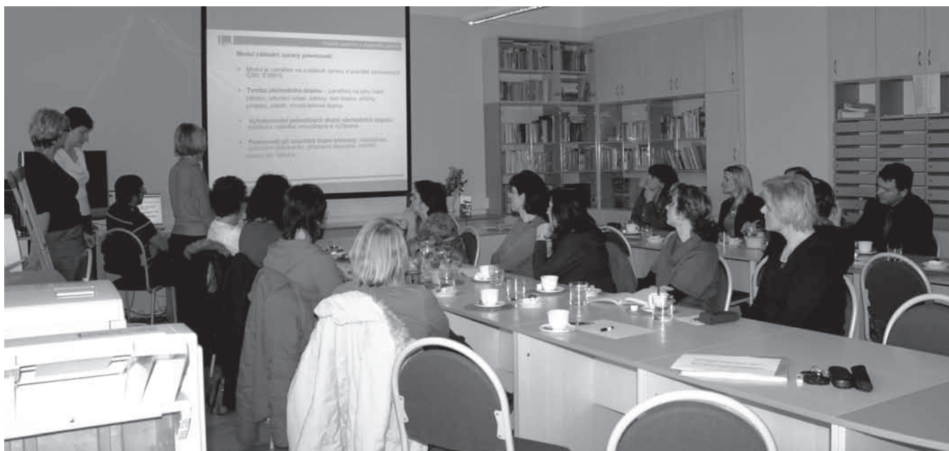
Snímek z průběhu prvního ze tří vzdělávacích programů.