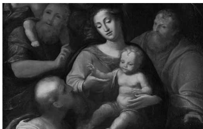
Svatá rodina, neznámý florentský malíř, 16. století, jeden z nedávno restaurovaných obrazů Státního zámku Vizovice.

Bližší informace na www.zamek-vizovice.cz nebo na tel. 724 316 410. Změna programu vyhrazena!