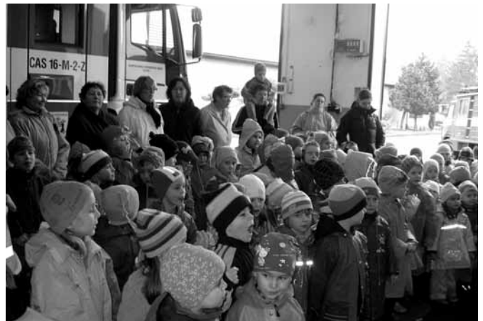
Účast byla hojná, děti zvláště zvědavé.