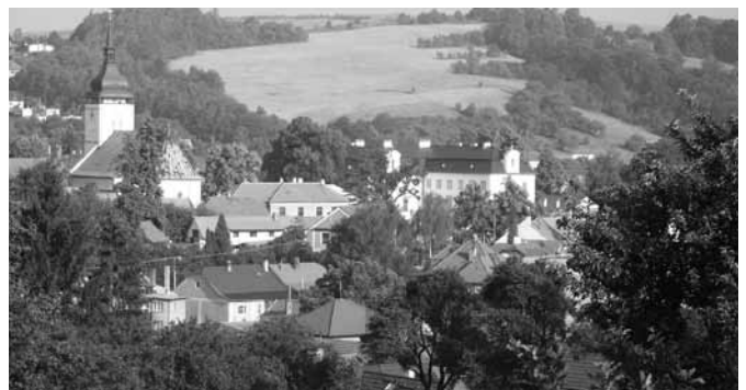
Vizovice – ilustrační foto Ing. Miloslav Vitek.