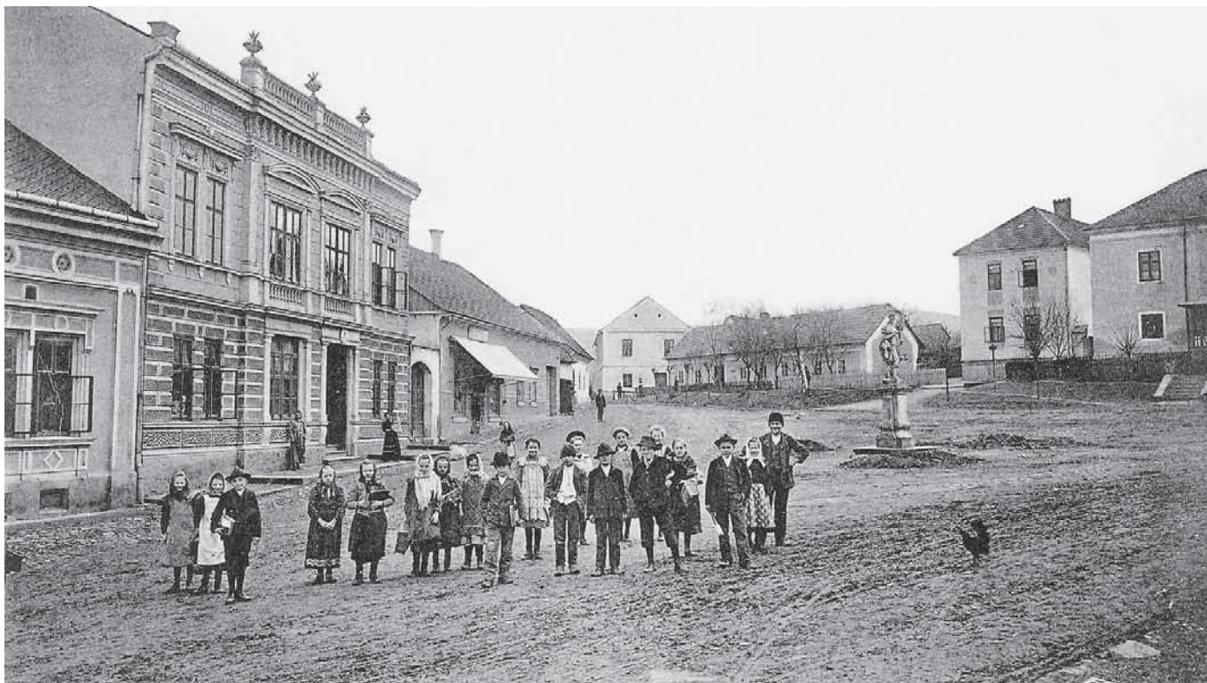
Vizovice, Palackého náměstí, 1908, vydal Rudolf Macháček, ze soukromé sbírky zapůjčil Jiří Madzia.