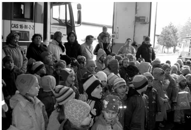
Účast byla hojná, děti zvláště zvědavé.