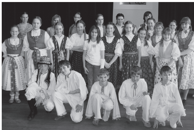
Vizovjáneek - ilustrační foto.