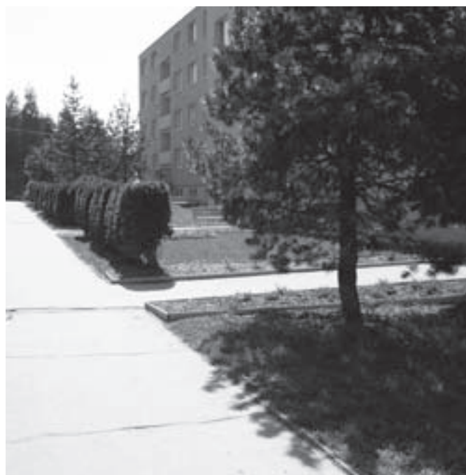
Sídliště Růžová - ilustrační foto.