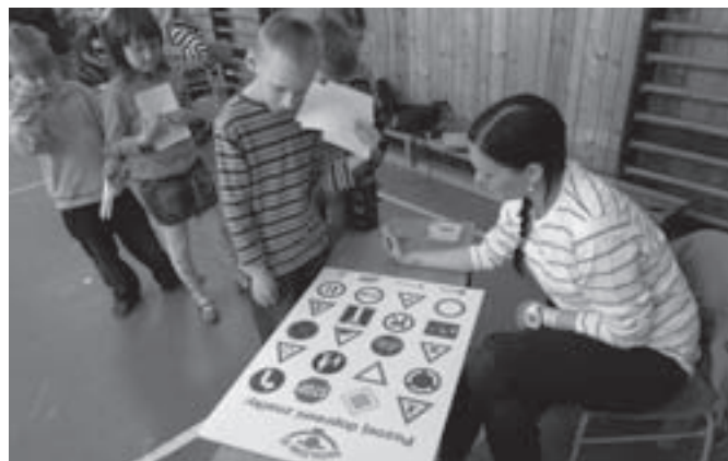
Děti se učí poznávat dopravní značky.