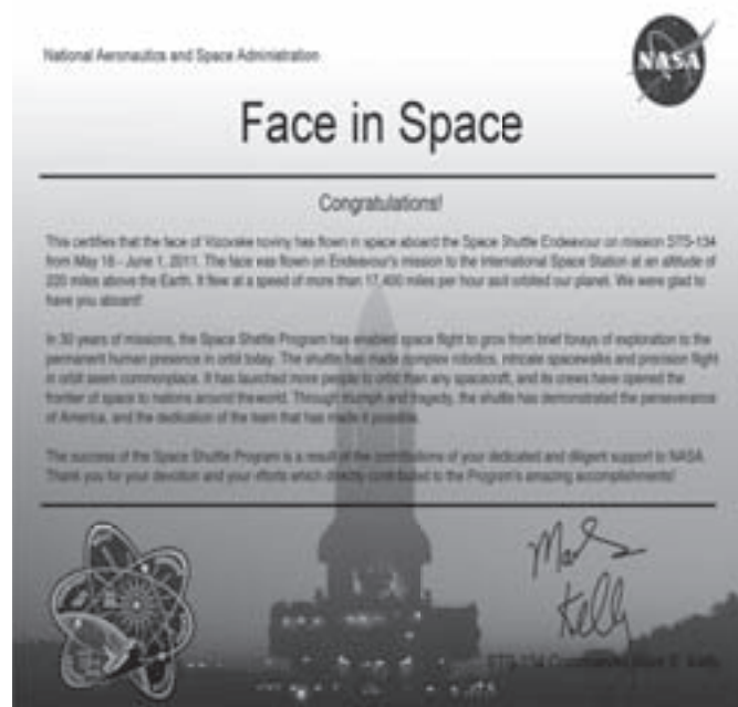
Certifikát Národního úřadu pro letectví a kosmonautiku.