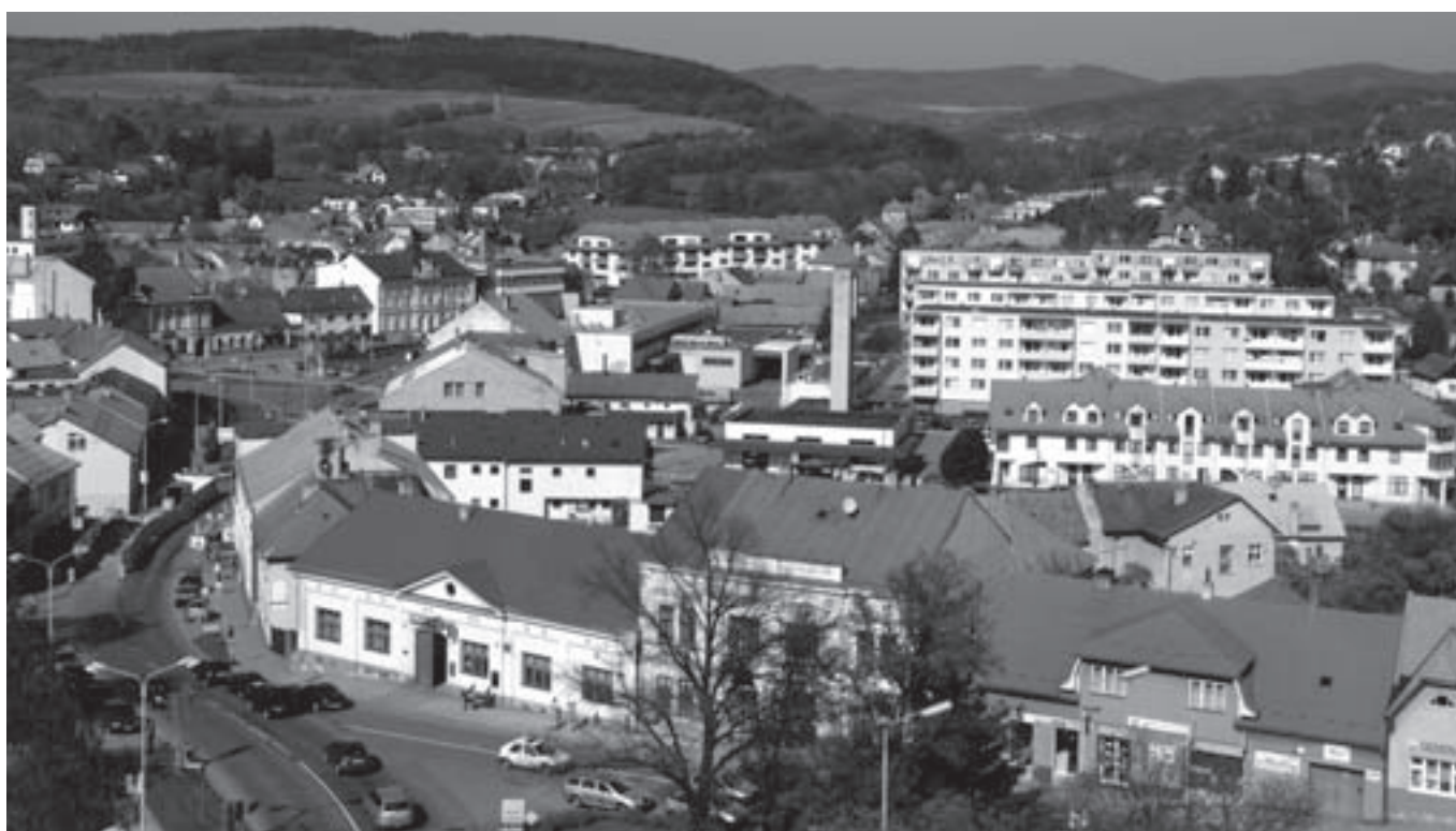
Vizovice, pohled z věže, květen 2011, foto Renata Mládenková.