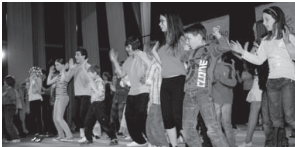
Vystoupení dětí v rámci jedné z kategorií.

Regionální kolo 18. ročníku přehlídky kulturních aktivit dětí z dětských domovů nazvané „Nejmilejší koncert“ se tentokrát konalo ve Vizovicích. Pořadatelem byl Dětský domov a Základní škola