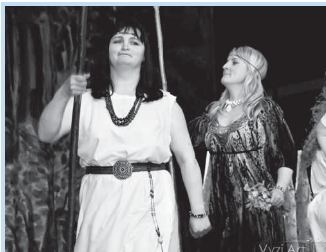
Dívčí válka v provedení Ublanů.