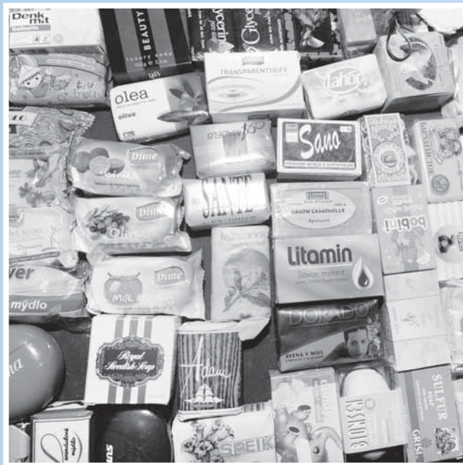
Některá balení a krabičky mýdel mnozí z nás pamatují.

„Sbírkou jsem poprvé vystavila v roce 2008, pak 2010 a nyní. Od té doby, co jsem je poprvé vystavila, rozšířila se mi sbírka