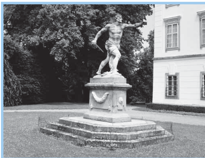
Gladiátor v zámecké zahradě.