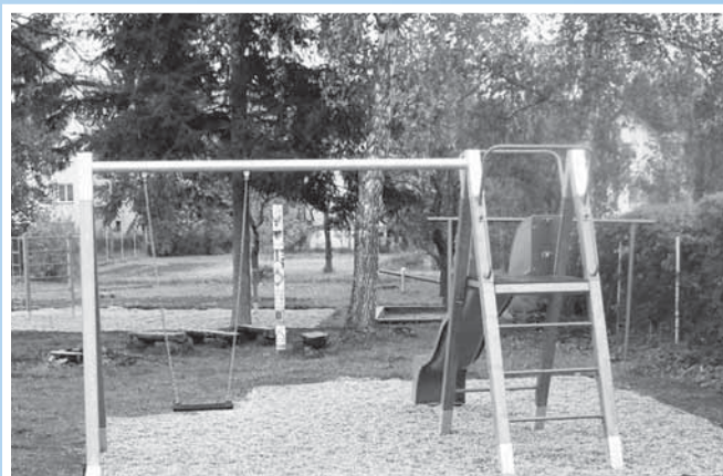
Nově vybudované dětské hřiště na ulici Slušovské je i pro veřejnost.

Dokončení těchto prací umožnilo zpřístupnit hřiště veřejnosti ještě před plánovaným termí-