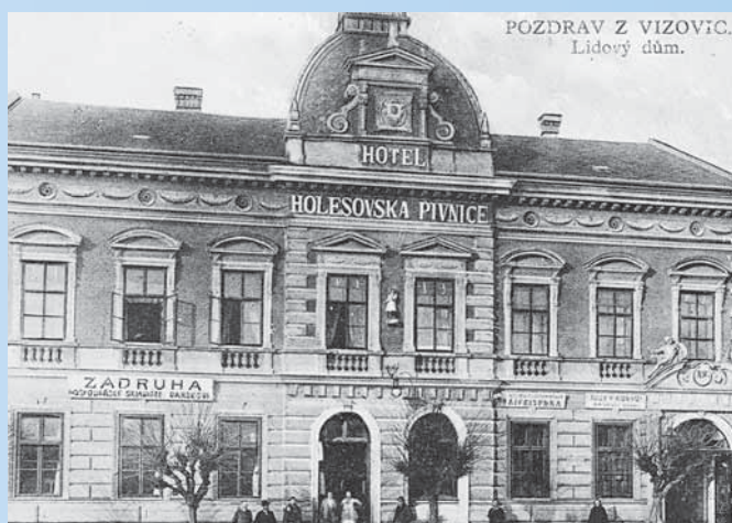
Lidový dům s původní Holešovskou pivnicí

paměť a těm mladším ukážeme, kde stály a jak vůbec některé podniky vypadaly. V dalším čísle VN nás mimo jiné ještě čekají Mojžíšovy lázně či hospoda Na Vinném.