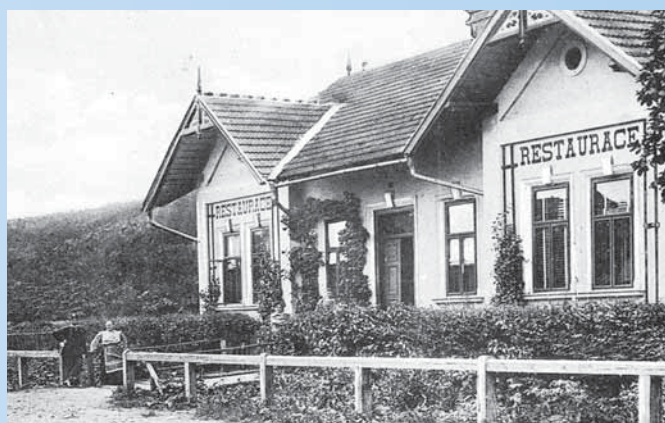
Gajdošikova hospoda u nádraží