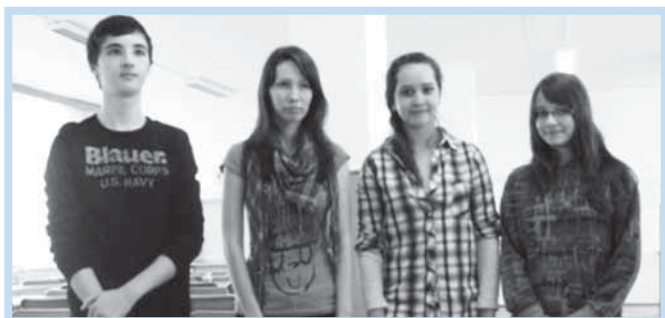
Úspěšní žáci v soutěži v anglickém jazyce.