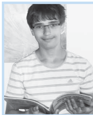
V krajském kole byl Jirka druhý.