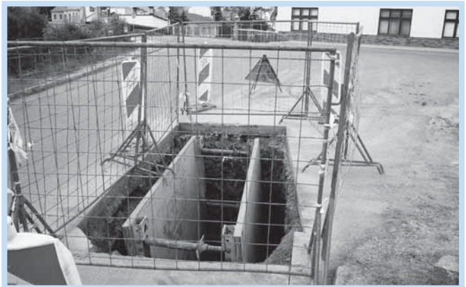
Stavební práce na ulici Kopanické.