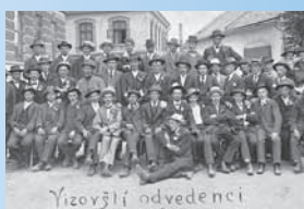
Odvedenci z Vizovic.

- fotografie odvedených mláďenců z Vizovic poříze- ná za Starou školou. Mnozí skončili na východní frontě či v légiích.