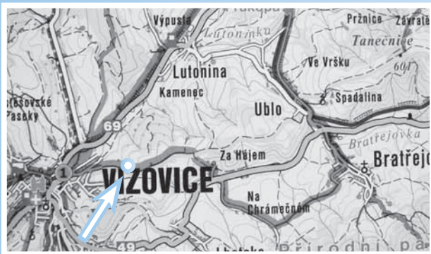
Část cyklotrasy. Šipka označuje umístění lavičky.