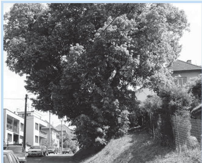
Památná lípa má více než 300 let.

přírody a krajiny MÚ ve Vizovicích v roce 1996. Stáří stromu je odhadováno na více než 300 let.