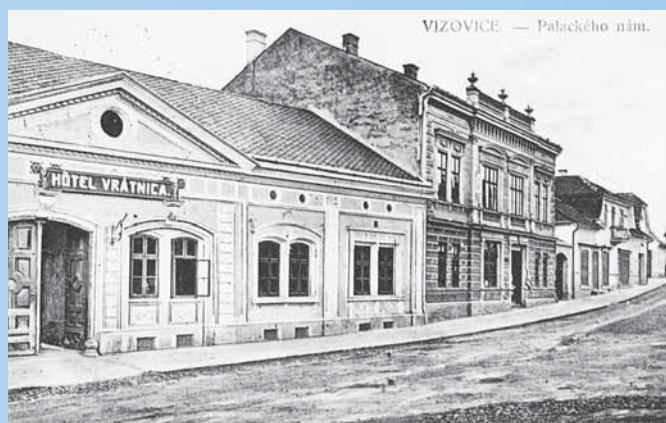
Slováckův zájezdní hostinec - hotel Vrátnica