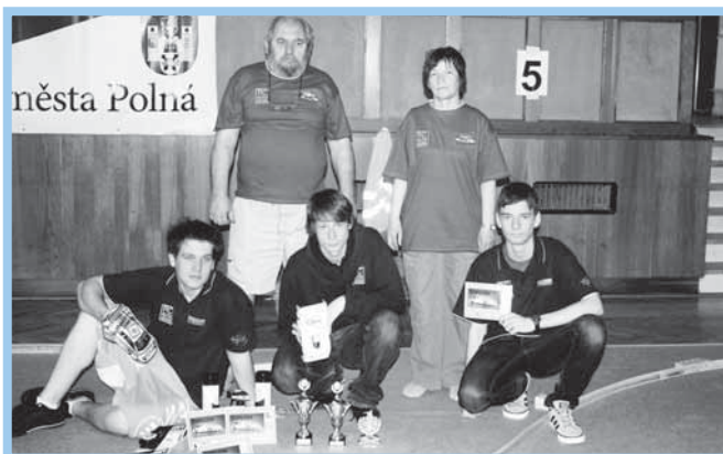
Získaná ocenění našich modelářů.