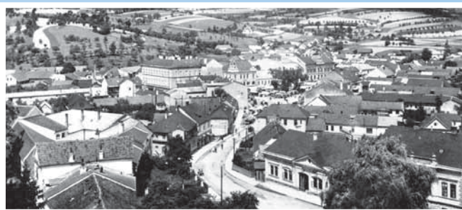
Dobová fotografie Vizovic z předválečných let.