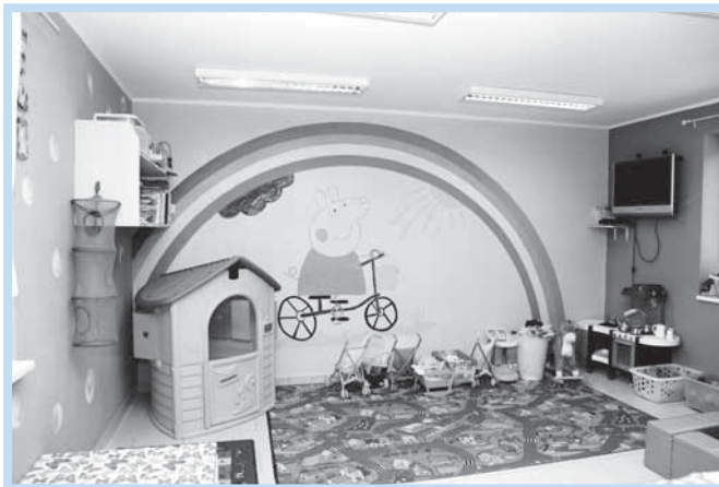
Veselý interiér s pestrými barvami děti láká.