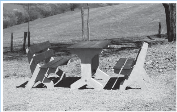
Nově zakoupený lavičkový set.