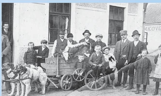
Vizovjani před oblíbenou, dnes již neexistující hospodou Na špici na rohu ulice Krňovské a Masarykova náměstí