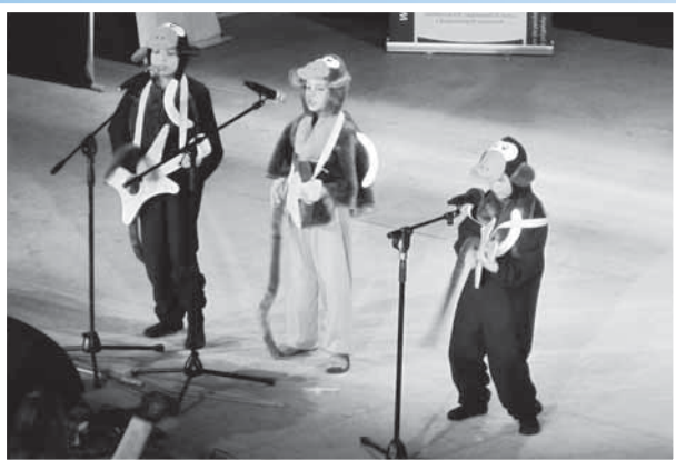
Přes 90 dětí předvedlo své nadání a talent.