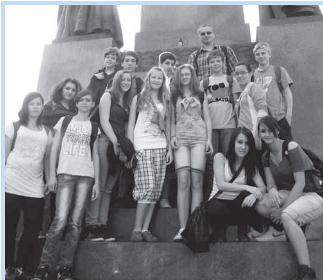
Vizovští žáci na Václavském náměstí u sochy Sv. Václava.