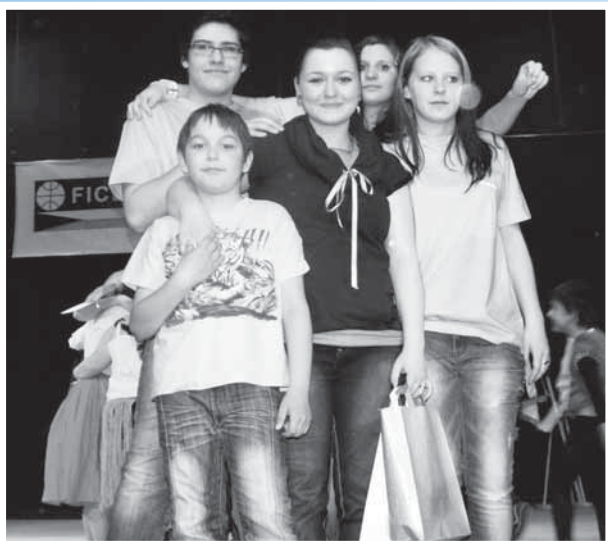
Všem dětem zůstanou pěkné vzpomínky.