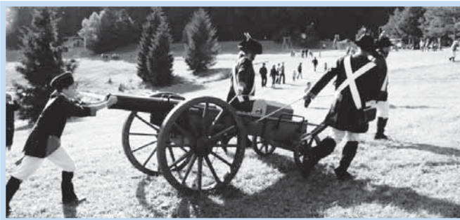
Ukázka historické vojenské bitvy.