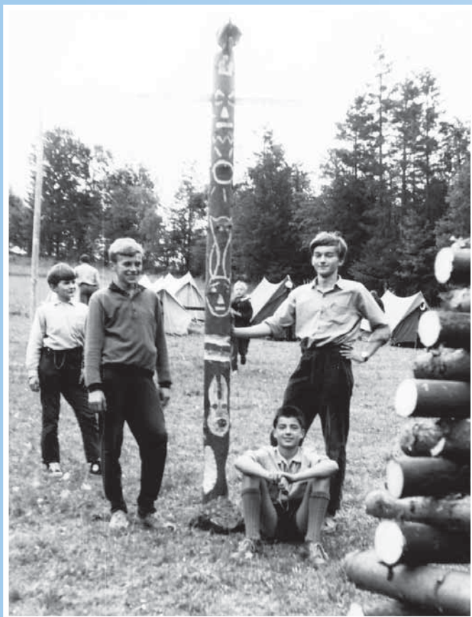
Dobová fotografie prvních junáků.